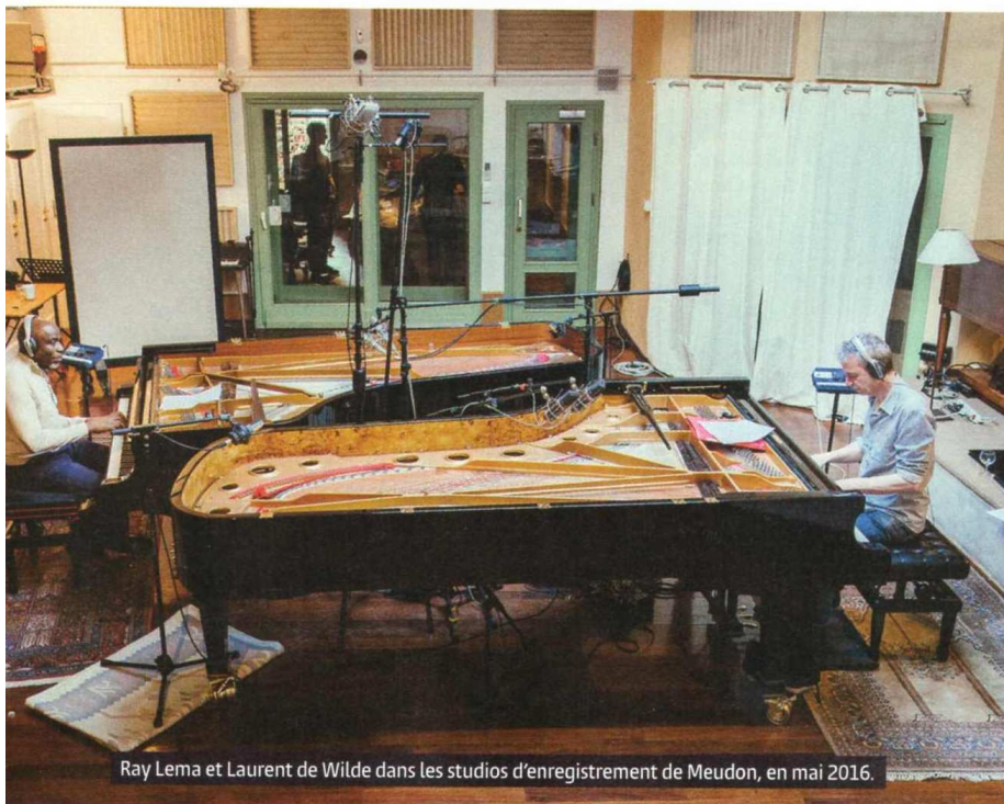
Ray Lema et Laurent de Wilde dans les studios d'enregistrement de Meudon, en mai 2016.